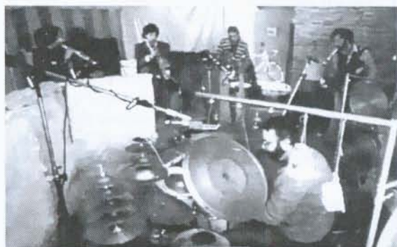
Rova & Centazzo 1978 - photo

Mon père m'a chaleureusement félicité et m'a dit : « Finalement tu l'as ! Il est maintenant temps pour toi de devenir quelqu'un et de commencer ta carrière de juriste dans notre cabinet familial ! » Je lui ai répondu que non, le deal était que j'obtienne le titre, pas que j'exerce la profession, et qu'il était temps pour moi de commencer ma carrière de musicien. Il ne m'a plus parlé pendant deux ans. Je suis parti vivre à Bologne. C'est plus tard, lorsqu'il a lu mon nom dans les magazines, qu'il a repris contact avec moi. Dans ses dernières années, il était devenu un vrai fan de ma musique ! » 4